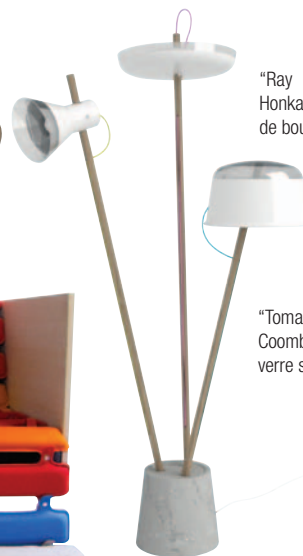
"Tomahawk", design Giopato et Coombes. Luminaires en bois et verre soufflé.